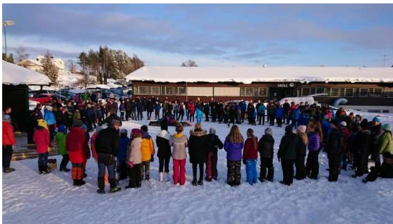
(Bilde fra merkehelgen 2019)

Søndag 9. februar 2020 Brekkenbygda, Røros