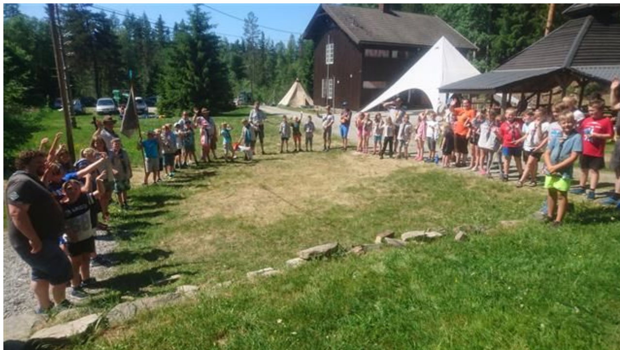
(Bilde fra småspeiderleir 2018)

Søndag 10. februar 2019 Misjonshuset i Innbygda, Trysil