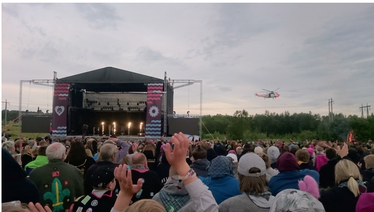
(Bilde fra landsleiren Nord 2017. Foto: Roy Arild Rugsveen)

Lørdag 10. februar 2018 Jølstad grendehus